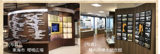
(写真) 東海市 嚶鳴広場