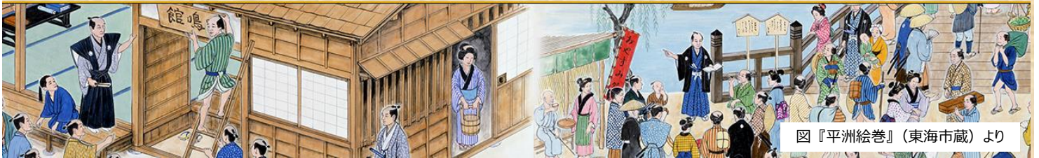
図『平洲絵巻』(東海市蔵)より

未曾有の人口減少、少子高齢化が進むなか、国全体では、郷土教育・ふるさと学習に見られる地域の価値探しの動きや、インバウンド消費に代表される観光流動が活発化しています。